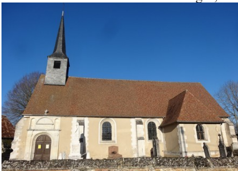
L'église de Graveron

Les avis seront cohérents avec ceux émis ces dernières années, à savoir : pas de maisons à volume compliqué (type V, W, Y, ou Z), pentes à 45° pour les volumes principaux, ardoise ou tuile plate de teinte brun vieilli, à 20u/m 2 , avec un débord de toiture de 20cm, enduit de teinte beige clair avec modénatures (au choix : chaînages, encadrement de fenêtres, soubassement, colombage...). *Voir les autres fiches.