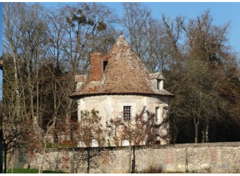
Le colombier aménagé en habitation