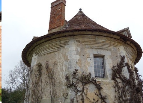
Détails du colombier