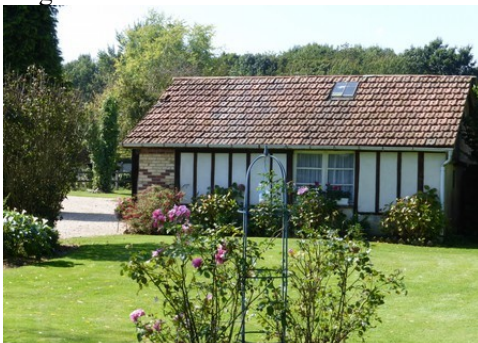
Une maison avec briques et pans de bois