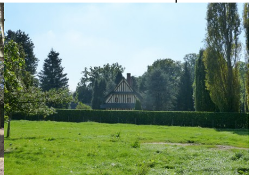
Le bâti rural dans son cadre arboré