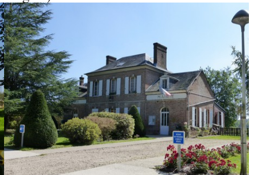
La mairie de Graveron en briques