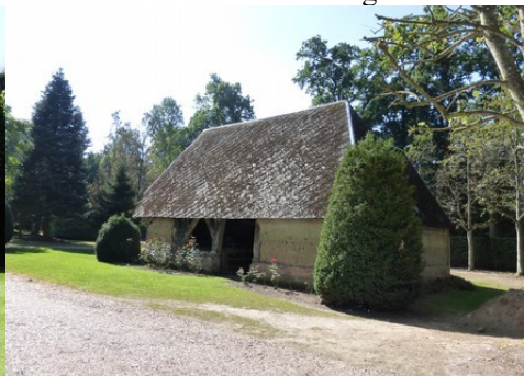
Un ancien bâtiment agricole