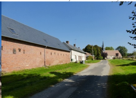
La vue des communes vers l'église