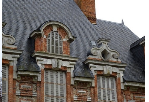
Détails de la façade

Pour la zone en rose foncé dans le périmètre de 500m