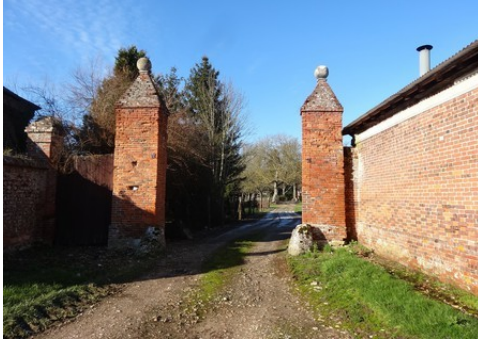
Le portail des communes