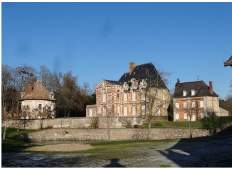
Le château vu de l'entrée des communes